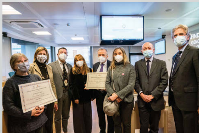
I vincitori del Premio Partnership Sociali 2021

Francesca Sanguineti, Ufficio Stampa Celivo