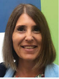
di Francesca Sanguineti